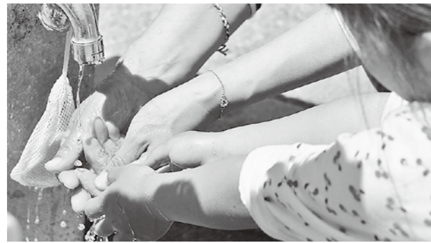
安心して使える水は私たちの生活に欠かせません

下水道事業会計の予算も「収益的収支」と「資本的収支」で編成しており、収益的収支は、本年度の事業計画(表4)を基に編成しており、収支差額は4468万円、1624万円の純利益を見込んでいます。資本的収支の不足額7億226万円は、減価償却費などから生じる損益勘定留保資金などで補てんする予定です。今後も水道・下水道事業の経営健全化や計画性・透明性の確保に努めていきます。