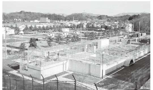
皆さんのもとへ安全・安心な水を届けています(西川浄水場前処理施設)

おり、収支差額は6871万円、1億6146万円の純損失を見込んでいますが、支出の中には、現金支出を伴わない減価償却費などが含まれていますので、資金不足となるものではありません。資本的収支の不足額6億2183万円は、減価償却費などから生じる損益勘定留保資金などで補てんする予定です。