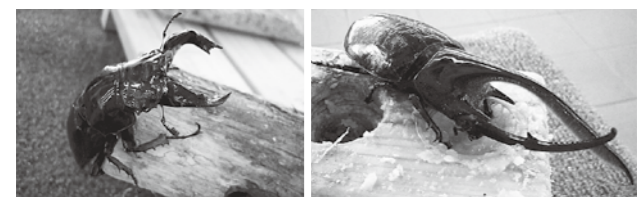
タランドゥスオオツヤクワガタ ネプチューンオオカブト

世界各地に生息するカブトムシやクワガタムシが、今年もムシテックワールドにやってきます。たくさんの昆虫を近くで見て、生物の多様性を感じてみよう！ 7月15日(土)～8月24日(木) 昆虫たちとの記念撮影コーナーもあります。詳しくは、ムシテックワールドホームページをご覧ください。