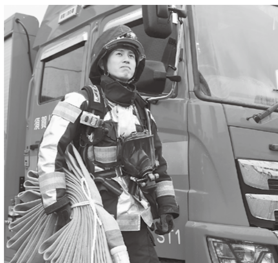
命や財産を守るため、知識や技術の習得に努めています

学生の頃、令和元年東日本台風の災害ボランティアに参加し「人を助けたい」「大切な命を守りたい」と強く思うようになり、消防士を目指しました。