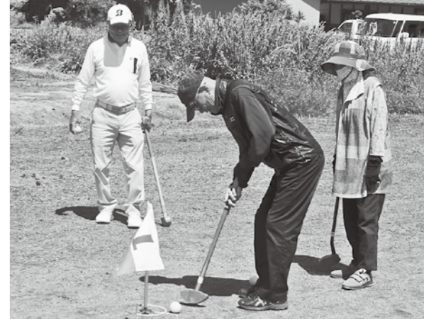
各地区の球技大会では高齢者の皆さんが元気にプレー