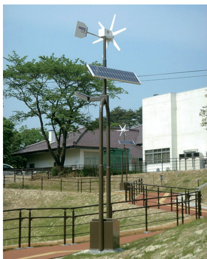
翠ヶ丘公園 (須賀川市)