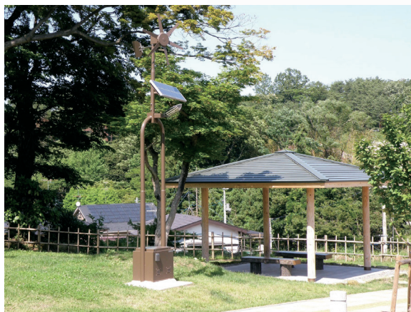
多代の宙 (須賀川市)