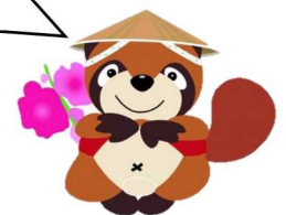
大東地域キャラクター 「大輝地くん」

大東コミュニティセンター事業の様子や 大東地区に関する情報などを配信します！！ ぜひ、皆さんのフォローをお願いします。