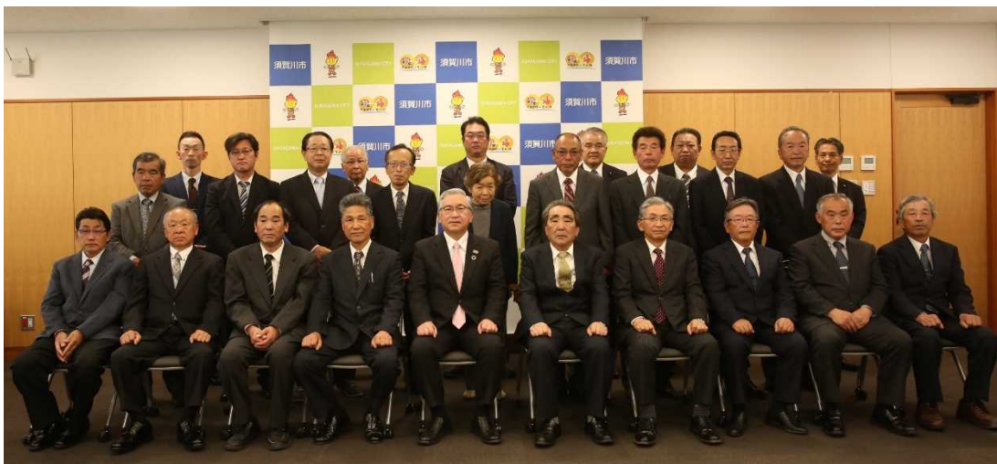
大東区長会市長面会