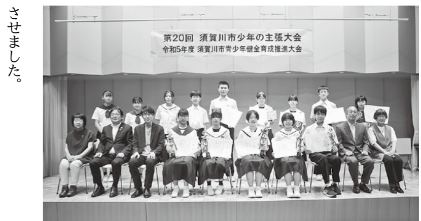
緊張の発表を終えて、最後は笑顔で記念撮影

そんな、いつも明るくて活気にあふれた母ですが、私が5歳の時、膠原病という、国の指定難病にかかりました。膠原病とは、自己免疫が自分の身体の正常な部分を細菌やウイルスと間違えて攻撃してしまう病気です。この病気の症状は人によって異なりますが、主にひどい痛みと痺れに襲われるといわれています。母の場合、それは右足に現れました。少しでも動かすと激痛が走るようで、涙を流しながら痛みを耐える母の姿は、5歳の私にも、並々ならぬ思いを感じ