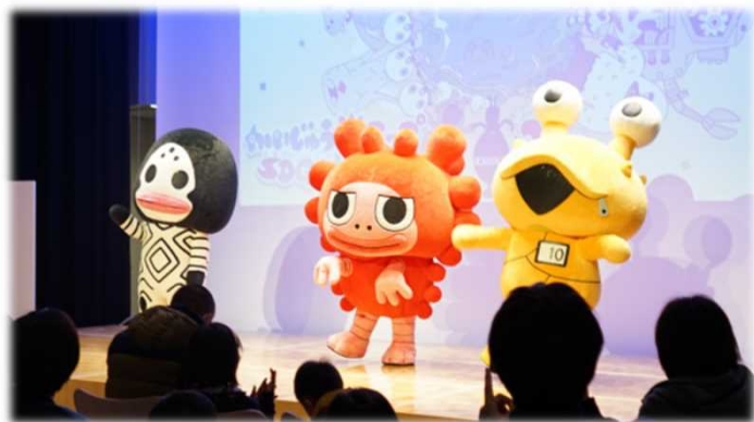
こどもかいじゅうのSDGsショー