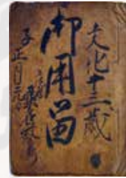
「御用留」桑名家文書(当館蔵)

.....申込み・お問合わせ 須賀川市立博物館 (TEL0248・75・3239)