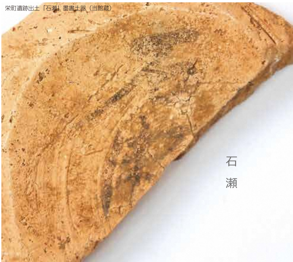
米町遺跡出土「石瀬」墨書土器 (当館蔵)