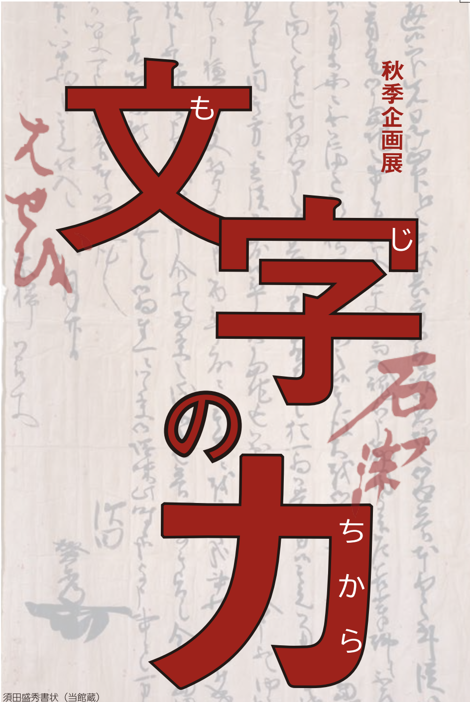
須田盛秀書状 (当館蔵)