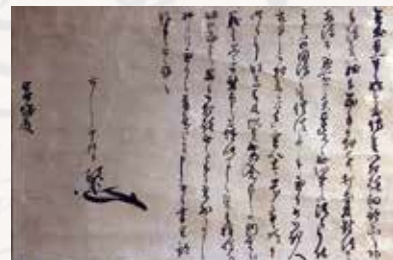
伊達政宗書状(個人蔵)