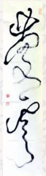
「慶雲」張堂大龍(当館蔵)