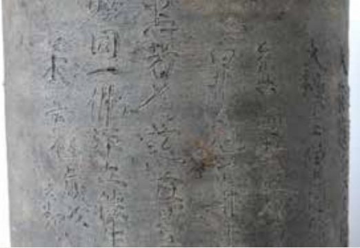
岩代米山寺経塚出土陶製経筒外容器（承安元年銘） 当館寄託 重要文化財

この企画展では、須賀川に関する墨書土器などの出土文字資料や中近世の古文書、文字による芸術（書）、須賀川ゆかりの人物の筆跡、絵と書が組み合わされた書画など、古代から現代までの文字資料や作品を展示します。