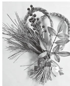
手作りの正月飾りですてきな新年に