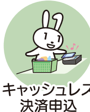
キャッシュレス 決済申込