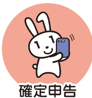
確定申告 (2024年度より)