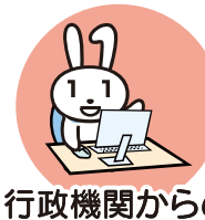
行政機関からの お知らせ・各種証明書