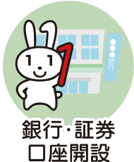
銀行・証券 口座開設