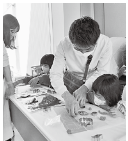
どんなストラップができるかな?

関連講座 ▶3月2日(土) 「ゴム製ストラップ作り」 ▶3月16日(土) 「味噌仕込み体験」 詳しくは、ホームページをご覧ください。