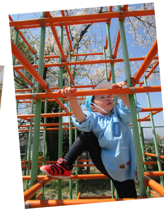
「こうえんであそべて、うれしい♪」園庭を公園と呼ぶ姿がかわいらしいですね。