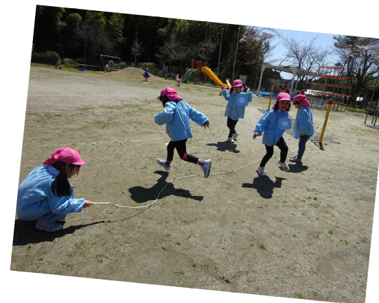
年長さんは活発です！