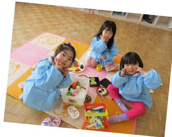
ごちそうを張り切って作りました