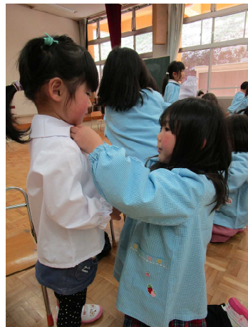
身体測定ではひまわり組さんがお着替えを手伝ってくれました！