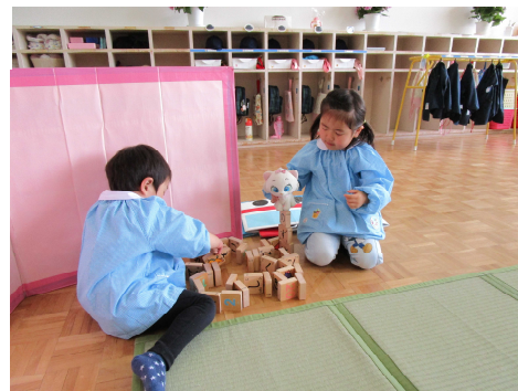
お友達の遊びに関心が出てきました。