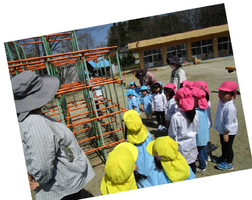
幼稚園探検！ひまわり組さんが、遊ぶ時のお約束を教えてくださいました！