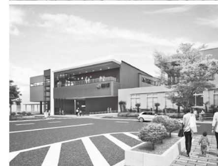
令和6年度末に完成予定の須賀川駅東西自由連絡通路・新駅舎完成イメージ