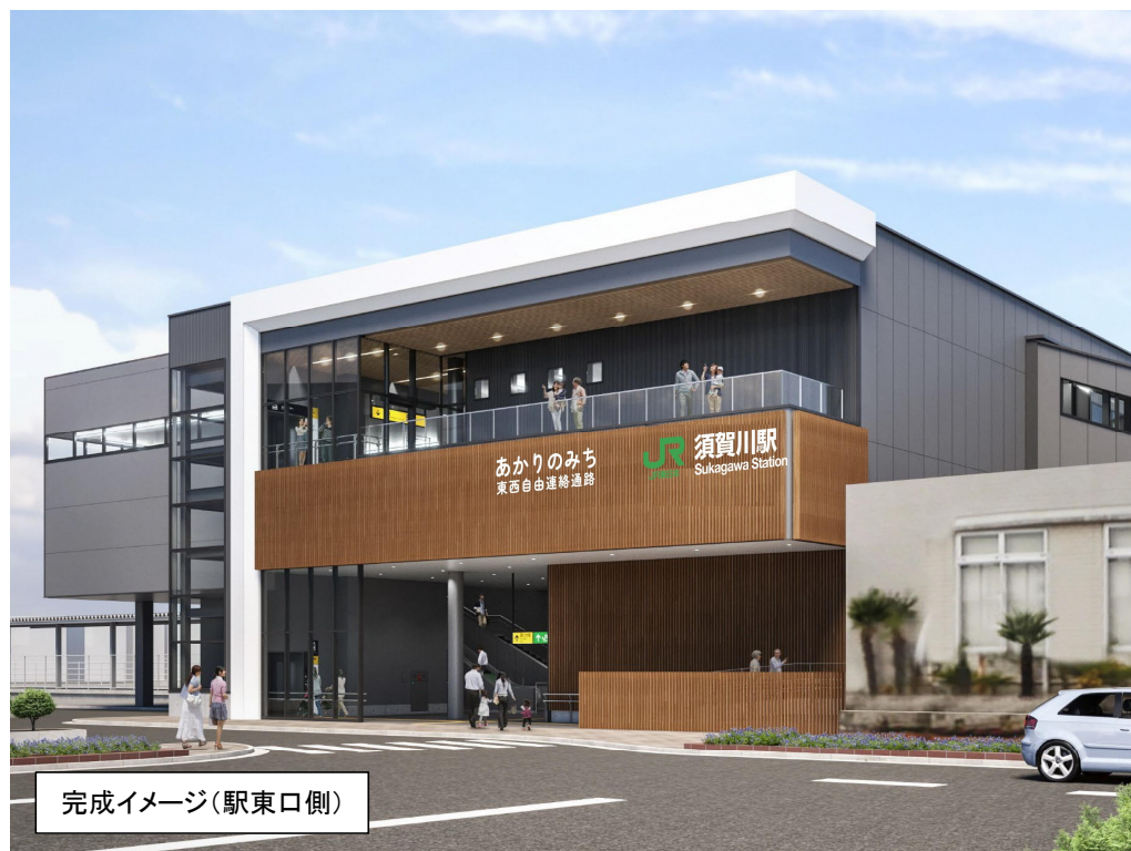
完成イメージ(駅東口側)