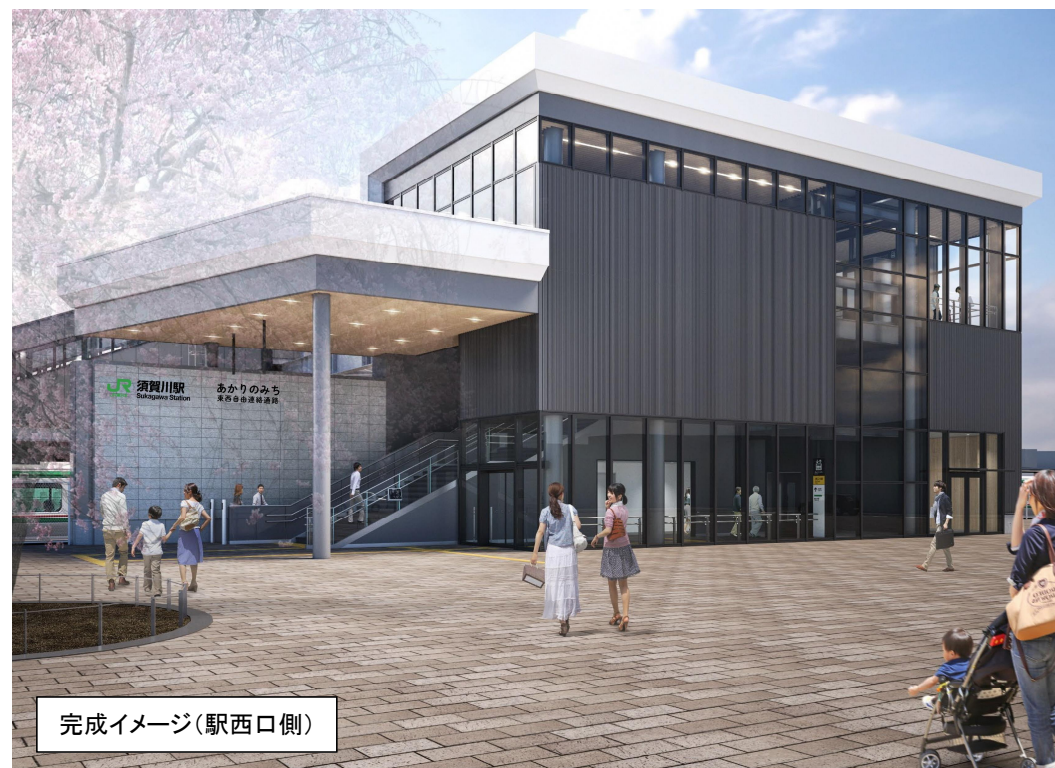
完成イメージ(駅西口側)