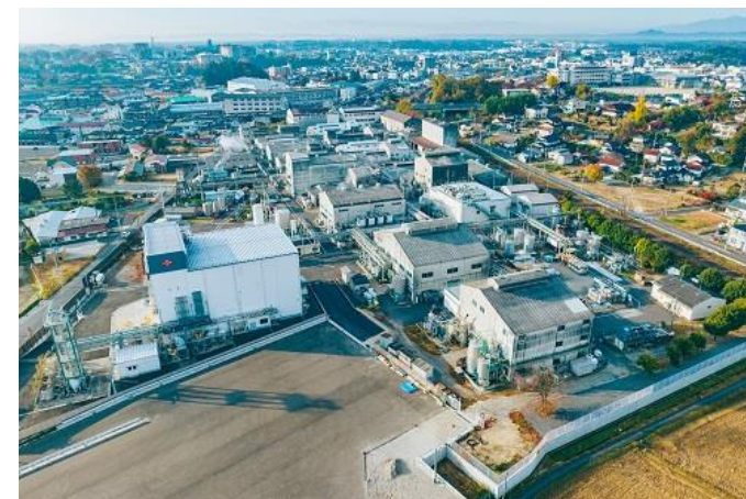
大内新興化学工業(株)