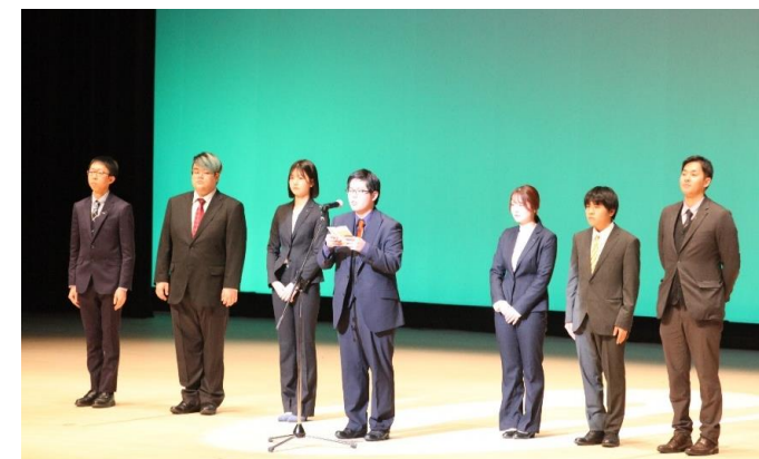
令和6年須賀川市二十歳のつどいの様子