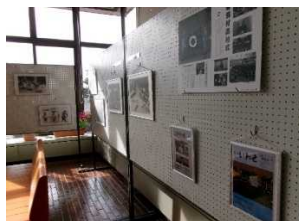
ロビーで展示された 「合併20周年写真で みる長沼と岩瀬」展

なお、2階に展示している「岩瀬ノ時代(いわせのとき)」は引き続き見学できますので、来館した際はぜひお立ち寄りください。