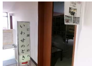
2階で展示されている 「岩瀬ノ時代(いわせ のとき)」展