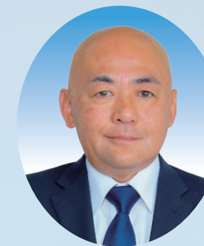
須賀川市長 大寺 正 晃