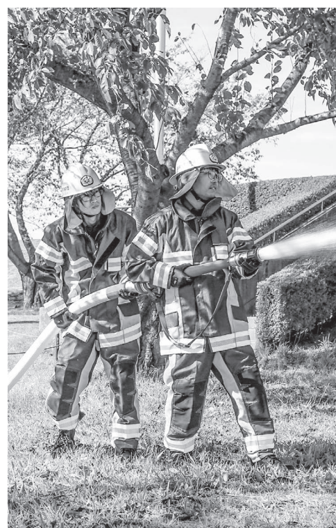
もしもに備えて訓練(市防災訓練・令和7年9月28日)

▼日常生活の防火・防災意識が高まる ▼業種や世代を超えた団員同士の交流が持てる ▼団員証を提示することで「がんばれ須賀川市消防団応援事業所」のサービスが受けられる