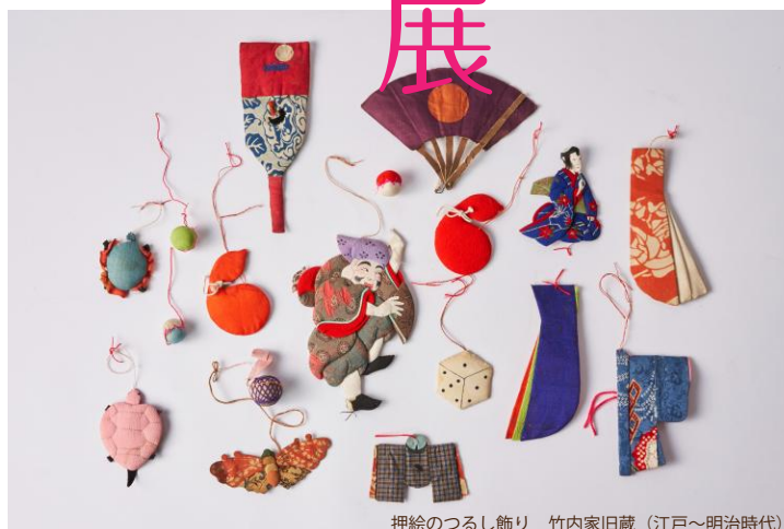
押絵のつるし飾り 竹内家旧蔵（江戸～明治時代）

今回の展示では、雛人形といっしょにご寄贈いただいた手作りの雛飾りやおもちゃに注目します。様々な時代の雛飾りと当時の手芸品を通して、昔の人たちとの心の交流をお楽しみください。