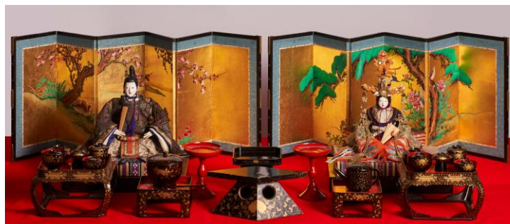
古今雛 近藤家旧蔵（江戸時代）

開館時間 午前9時～午後5時（入館は午後4時30分まで） 会期中の休館日 2月9日（月）、2月12日（木）、2月16日（月）、 2月24日（火）、3月2日（月） 観覧料 大人200円（150円） 大学生・高校生100円（70円） ＊（ ）は20人以上の団体料金 ＊中学生以下・65歳以上は無料 ＊身体障がい者手帳・療育手帳・精神障がい者保健福祉手帳・指定難病医療費受給者証をお持ちの方と介助者1人は無料