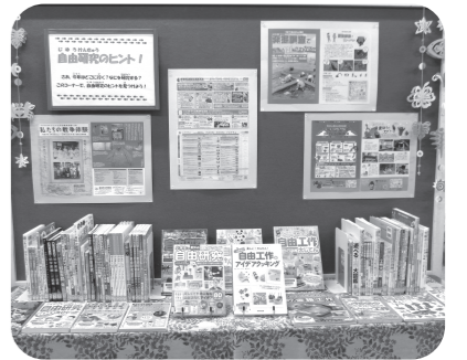
岩瀬図書館「自由研究のヒント！展示」(昨年の様子)