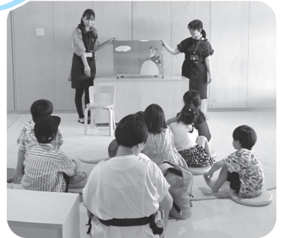
中央図書館「夏休みおはなし会」(昨年の様子)