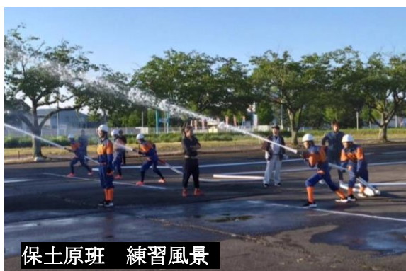
保土原班 練習風景