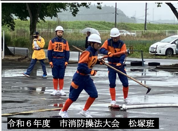
令和6年度 市消防操法大会 松塚班

〒962-0043 須賀川市岩渕字岡谷地 32 番地 1 TEL 0248-92-2003 FAX 0248-92-2004 E-mail inada@city.sukagawa.fukushima.jp