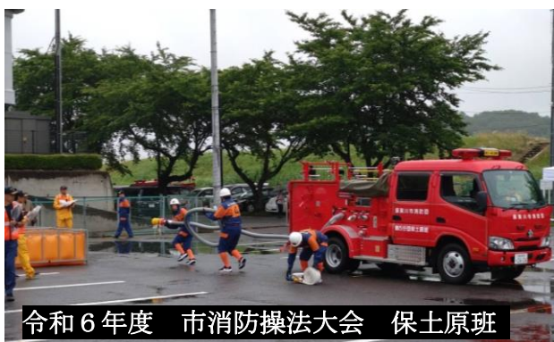
令和6年度 市消防操法大会 保土原班

優勝した松塚班は、7月28日(日)9時から市民スポーツ広場駐車場で開催される県消防協会須賀川支部大会において、鏡石・天栄の優勝チームと戦いを繰り広げます。熱いご声援をお願いします。