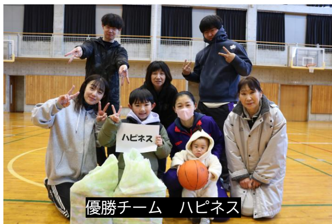
優勝チーム ハピネス