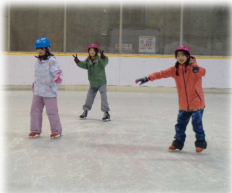
友達と一緒にスケートを楽しみました

「小学3年生以下」「小学4年生以上」「保護者」の3つのグループに分かれ、滑り方の練習を始めました。序盤はリンクに立つことや前に進むこともままならない様子でしたが、講師の指導を受けると、子供たちの飲み込みは早く、瞬く間に滑れるようになりました。自由滑走時には、少しスピードを上げて広いリンクを滑走する姿が見られ、大満足の様子でした。保護者の皆さんも一緒に滑ったり、リンク外からお子さんの写真を撮ったり、冬ならではのスポーツを満喫していました。「初めての体験だったけど楽しく滑れた」「また来年も参加したいです」との声が聞かれ、事業は大成功で終えることが出来ました。