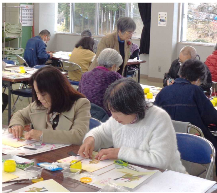
土台の馬の絵に、指先を使って丁寧に貼り付け