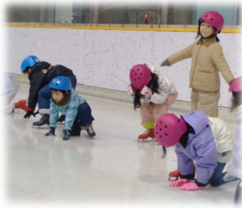
がんばってリンクに立つ練習をする子どもたち