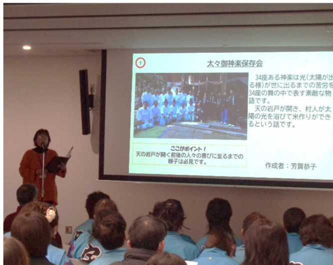
発表者の小塩江地区一押の宝を発表しました

12月14日（日）、須賀川市役所大会議室にて、これまでの活動の集大成である合同発表会が開催されました。稲田地区、小塩江地区それぞれの参加者が再発見した選りすぐりの「宝」を発表。来場した市民の皆さんは、地域を知る貴重な機会となりました。最後にアトラクションとして稲田地区からは「稲田昔話紙芝居」、小塩江地区からは「塩田太々御神楽」と「宇津峰YOSAKOI」の演舞を披露。会場は大盛り上がりとなりました。