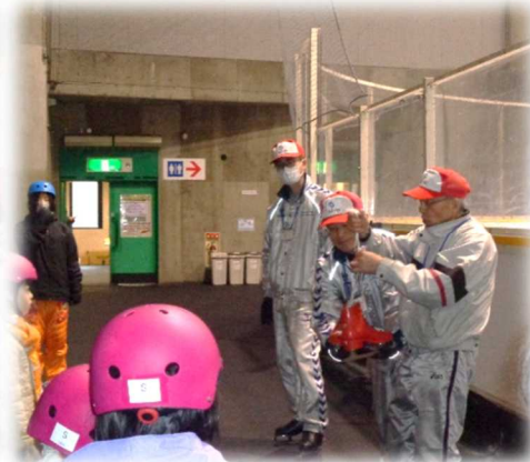
スケート靴の履き方から教えてもらいました