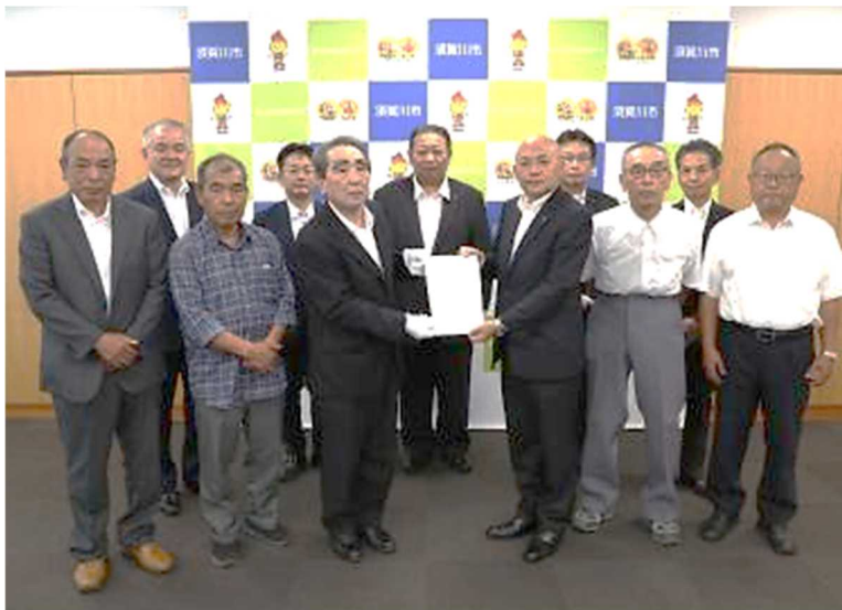
大寺市長へ東部地区の要望書を提出しました