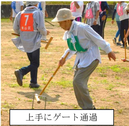
上手にゲート通過