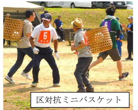
区対抗ミニバスケット