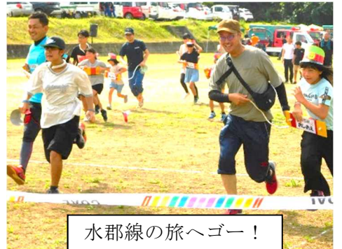
水郡線の旅へゴー！