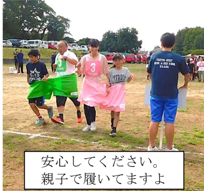
安心してください。 親子で履いてますよ