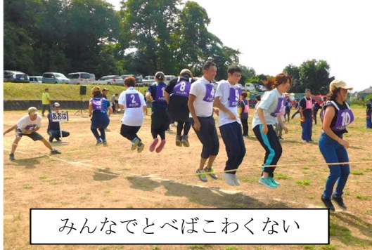
みんなだとべばこわくない