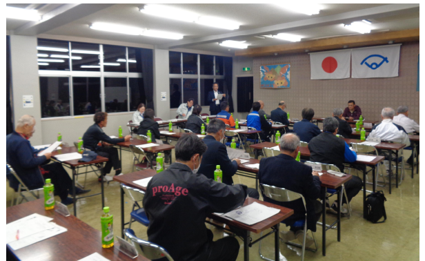
《明るいまちづくりの会》