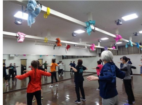
エクササイズ教室