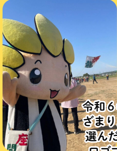
令和6年の様子。大凧が揚がって、 ざまりんも大喜び♪市民の皆さんが 選んだ、「やっぱ座間が好き！」の ロゴマークの凧も掲示しました。