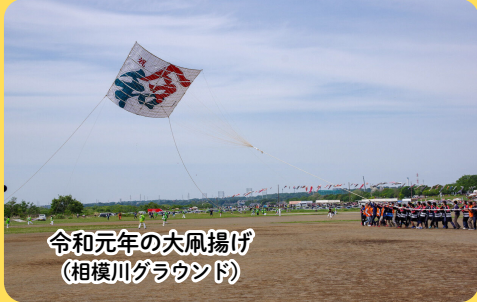
令和元年の大凧揚げ (相模川グラウンド)

座間の「大凧揚げ」は、江戸時代後期の文化・文政年間（1804年～1830年）に「端午の節句」を祝う催しとして始まり、200年以上の歴史を持つ伝統行事です。当初は、2間（3～4m四方）程度の大きさで、各地域の家々で個々に作って揚げていました。時代が進むにつれて凧が大きくなり、各地域の青年達が協力して作り、揚げるようになりました。現在の大きさになったのは明治時代中頃からですが、家や電柱が多くなるに従って掲揚の場所がなくなり、田んぼで行われるようになり、昭和40年代に全市をあげて一箇所で揚げるようになり、昭和50年頃には大凧保存会が結成され、相模川グラウンドで開催するようになりました。昭和57年には「かながわまつり50選」に選定、平成3年には国の選択無形民俗文化財に指定され、伝統行事・伝統芸能として、例年、盛大に開催されています。