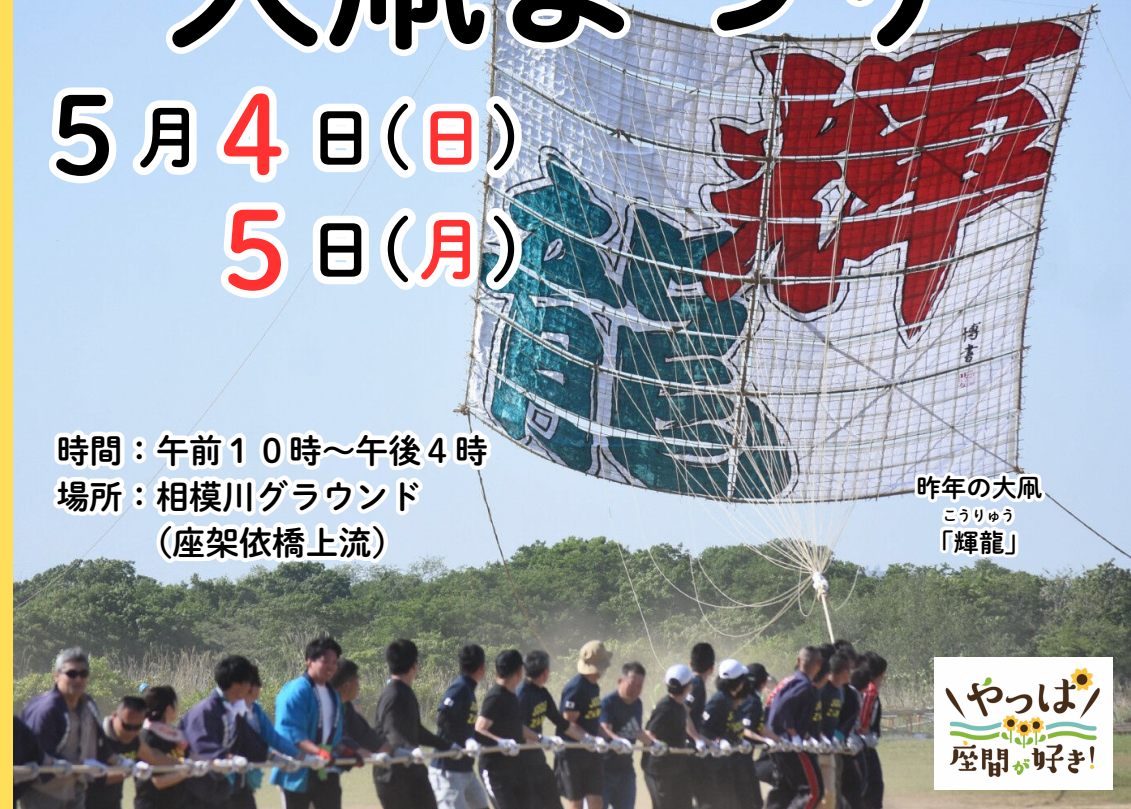
昨年の大凧 こうりゅう 「輝龍」