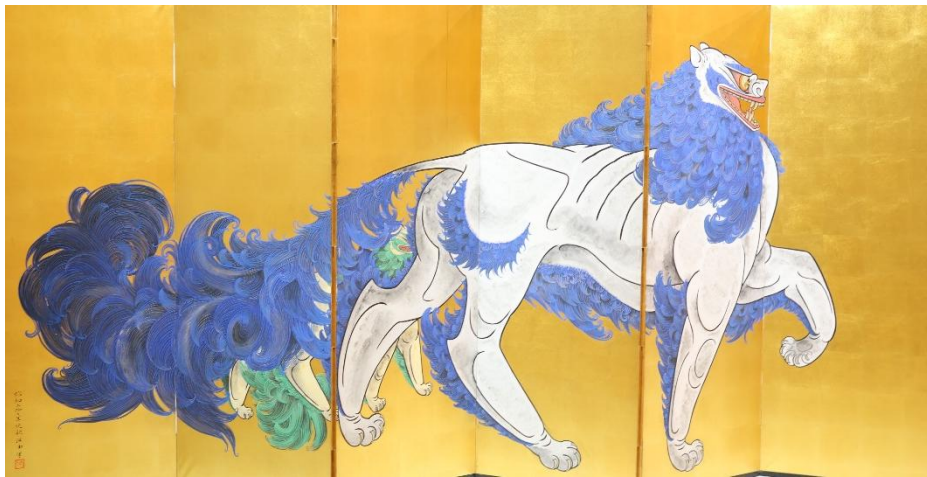
須田珙中「唐獅子」(左隻)