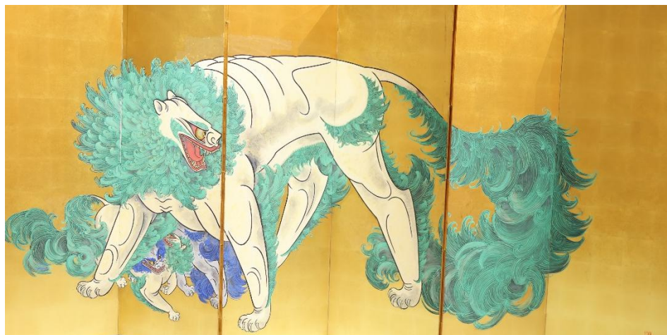
須田珙中「唐獅子」(右隻)