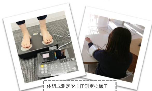
体組成測定や血圧測定の様子