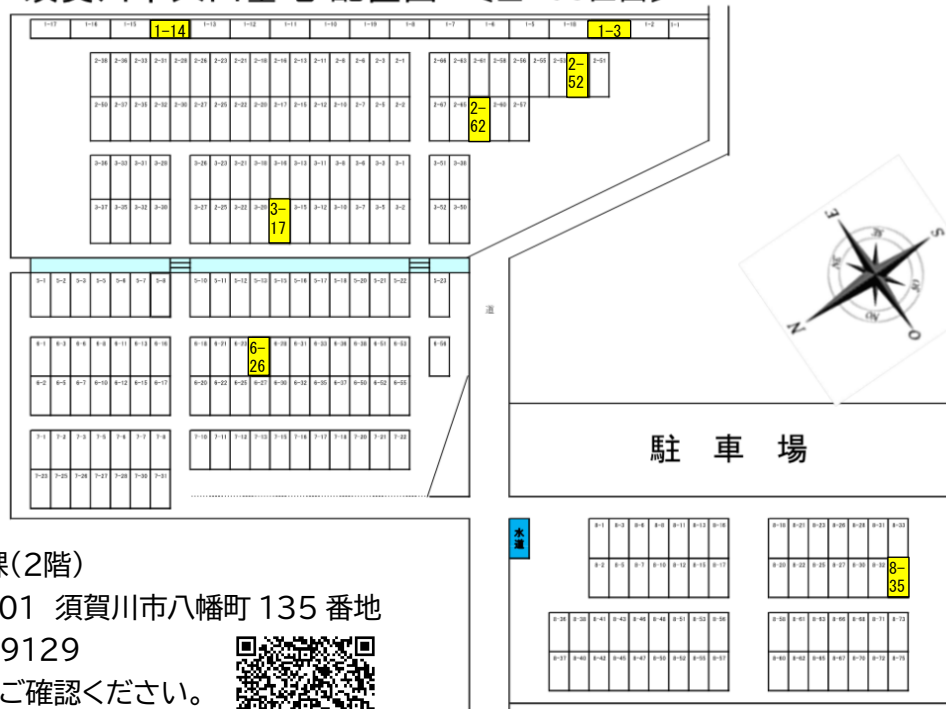
須賀川市大山墓地 配置図 [全238区画]