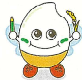
稲田学園マスコットキャラクター「いなっ子」