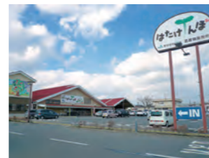
双葉のマークが目印。須賀川ICからも須賀川駅からも近くて便利

☎0248-94-4855 📍中町11 10:00~18:00 休 火曜日 📶可 📶無 MAP 3, 11