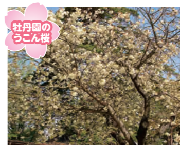
牡丹園のうこん桜

翠ヶ丘公園を流れる須賀川の両岸約1kmにわたり180本ほどの桜並木が続き、休日には観光客でにぎわう。