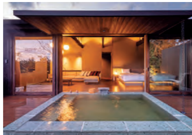
離れ88(はちじゅうはち)スイートルーム