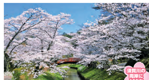
須賀川の両岸に180本

釈迦堂川河川敷の両岸に約2kmにわたり桜並木が続く。桜の開花時期にはライトアップされ、夜桜も楽しめる。