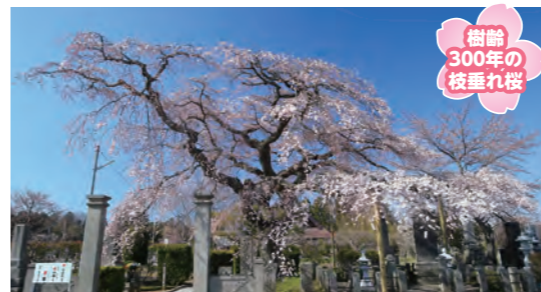
樹齢300年の枝垂れ桜

東西に長く標高差のある須賀川では、約1か月にわたって花見が楽しめる。樹齢300年以上の一本桜から、数キロに及び桜並木まで種類も多様なので自分好みの桜に出会いに行こう。