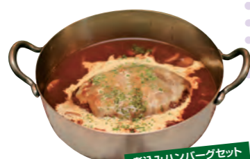
煮込みハンバーグセット 1400円

☎0248-72-5592 須賀川駅前7-2 11:30~14:00、17:30~21:00 火曜 可 無 MAP 11