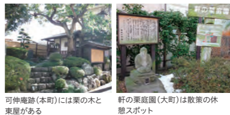
可伸庵跡(本町)には栗の木と東屋がある 軒の栗庭園(大町)は散策の休憩スポット

芭蕉が訪れた等閑屋敷の一角に可伸という僧が住む庵があり、ここで歌仙を巻いたと言われている。現在のNTT須賀川ビル付近にあったこの地は「可伸庵跡」として整備され、芭蕉の句碑「世の人の見付ぬ花や軒の栗」がある。