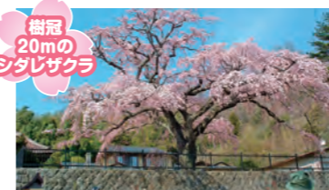
樹冠20mのシタレザクラ