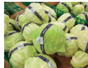
キャベツ1玉、上手に食べるとは？なんて話も食育ソムリエに相談してみよう