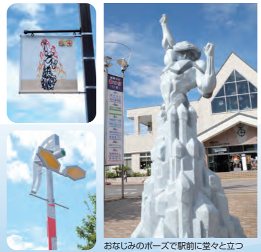
おなじみのポーズで駅前に堂々と立つ

駅前通りにはウルトラヒーローたちと須賀川名物のイベント等が描かれたタペストリーが並ぶ。ウルトラマンとウルトラセブンの街路灯についているスイッチを押すと音声が出る。