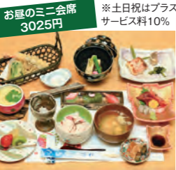
お昼のミニ会席 3025円 ※土日祝はプラスサービス料10%

自然の素材を活かした料理と、厳選された器が心を満たす日本料理店。お昼のミニ会席は旬の季節素材を詰め合わせ、お昼にちょっと贅沢な気分を味わうことができる。