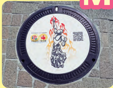
JR須賀川駅前に設置された ウルトラマン柄のマンホール

須賀川市は「特撮の神様」と呼ばれている、円谷英二監督の出身地です。これが縁となり、平成25(2013)年5月5日に、須賀川市とウルトラマンの故郷『M78星雲 光の国』は姉妹都市となりました。