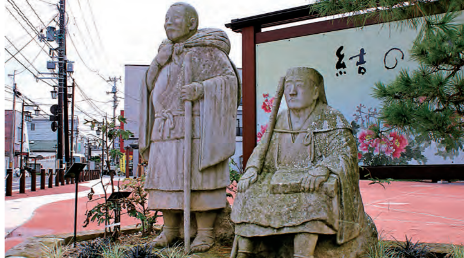
歴史を感じさせる須賀川の街並み。江戸時代は宿場町として栄えた。写真は結の辻に立つ芭蕉と曾良の像

☎0248-73-2941 須賀川東町53-5 7:30~18:30 火曜(祝日の場合は翌日) 可 有 MAP 11