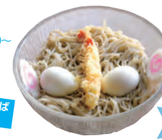
ウルトラマンそば 950円

☎ 0248-76-2008 📍 前田川字深田142 🕒 11:00~14:30 (土日祝、祝日は11:00~14:30、17:00~18:30) 📶 無休 🚗 不可 📶 無 MAP 18 G-5