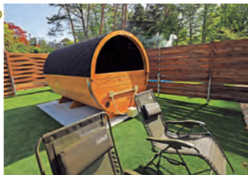
公園の中にあるスパ施設

☎0248-94-8626 📍愛宕山59-1 休 第3火曜日 📶📶📶 MAP 11