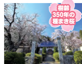
樹齢350年の種まき桜

高さ10m、幹周り約3mの枝垂れ桜。樹齢およそ300年。毎年桜の開花時期になると、夜桜のライトアップが行われる。