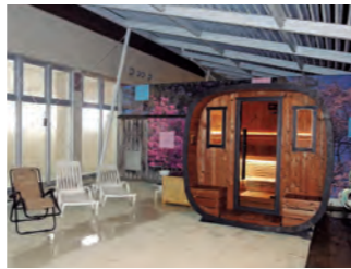
飛露喜や寫楽など銘酒も格安で味わえるのも魅力だ

☎0248-63-1112 📍湯川字関ノ上22-2 無休 📶入浴料90分:平日600円、土日祝700円 📶可 📶📶📶 MAP 18 G-2