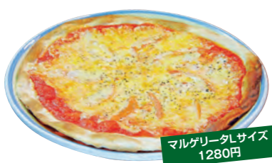
マルゲリータサイズ 1280円

街歩き楽しみのひとつは、やはり食事。古くから商業の街や宿場町として開けた須賀川には老舗からB級グルメまで美味しいものが揃う。