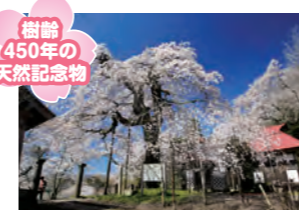
樹齢450年の天然記念物

福島県の天然記念物に指定されている推定樹齢450年、エドヒガンのシタレザクラが気品にあふれ美しい。