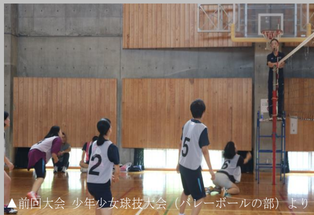
▲前回大会 少年少女球技大会(バレーボールの部)より

稲田学園の1~9年生児童生徒を対象に自由参加のイベントとなっておりますので、ぜひ、ご参加ください。