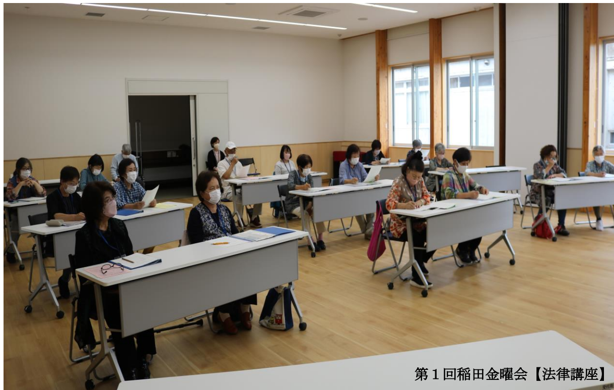
第1回稲田金曜会【法律講座】