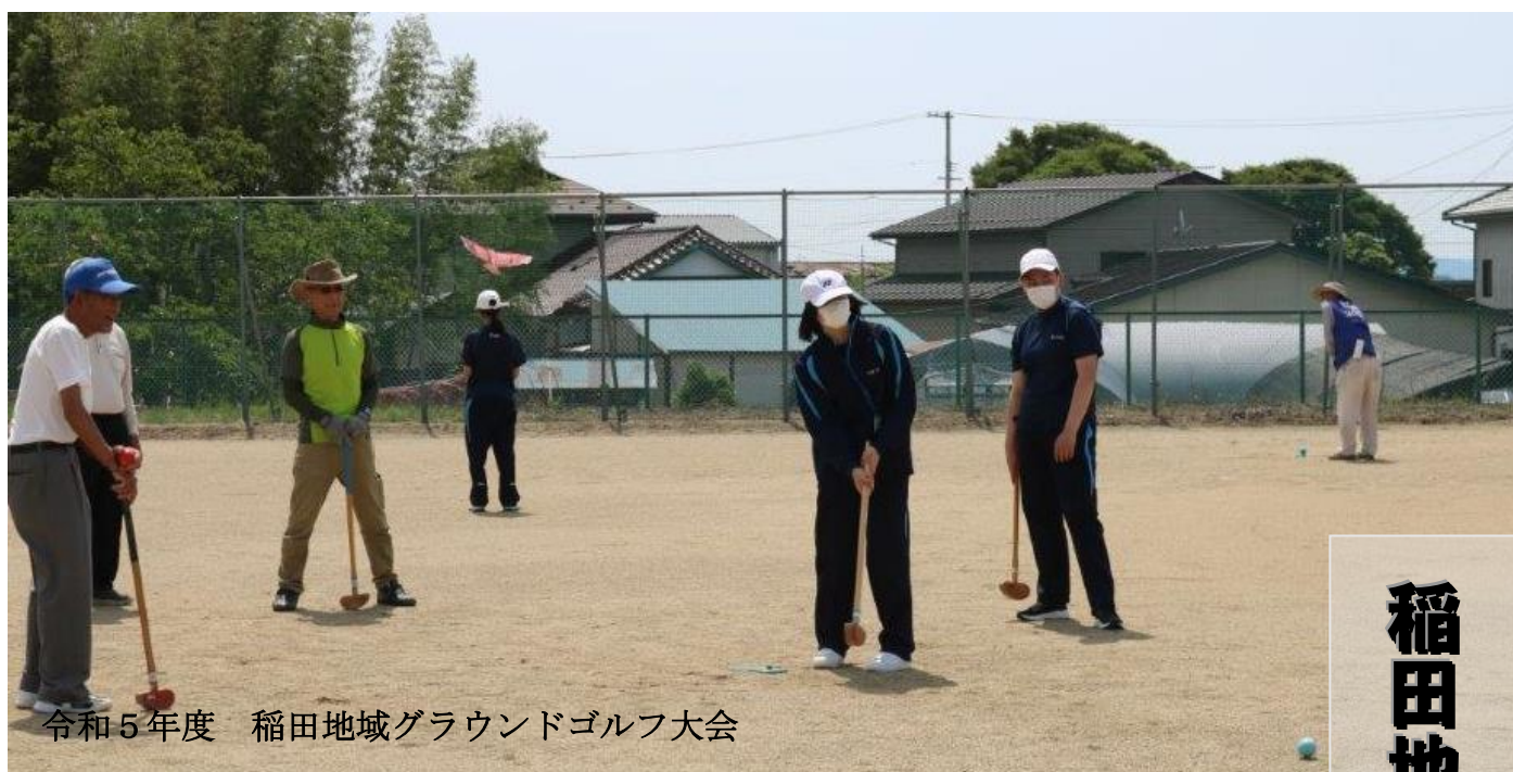
令和5年度 稲田地域グラウンドゴルフ大会

〒962-0043 須賀川市岩渕字岡谷地 32 番地 1 TEL 0248-92-2003 FAX 0248-92-2004 E-mail inada@city.sukagawa.fukushima.jp