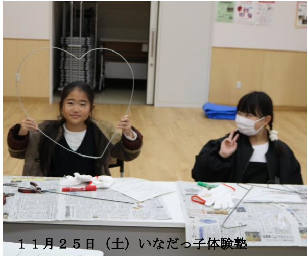
11月25日(土) いなだっ子体験塾