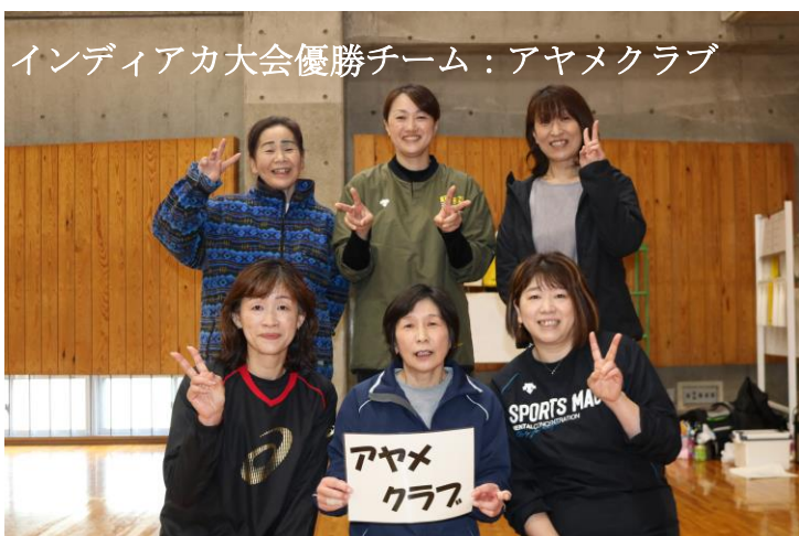
インディアカ大会優勝チーム：アヤメクラブ

12月10日(日)に稲田地域体育館で第10回稲田地域インディアカ大会を開催しました。 体育振興会役員会議の結果、10回目の節目も迎えたことから、最後の開催が決まった今大会には、7チームが参加し、それぞれAリーグとBリーグに分かれて試合を行いました。 予選は、1セット15点の2セットマッチで行い、決勝戦は、1セット15点の3セットマッチで行いました。 どのチームも熱中して試合を行っており、最後にふさわしい素晴らしい大会になりました。 今まで、インディアカ大会に参加、協力して下さった皆さま本当にありがとうございます。