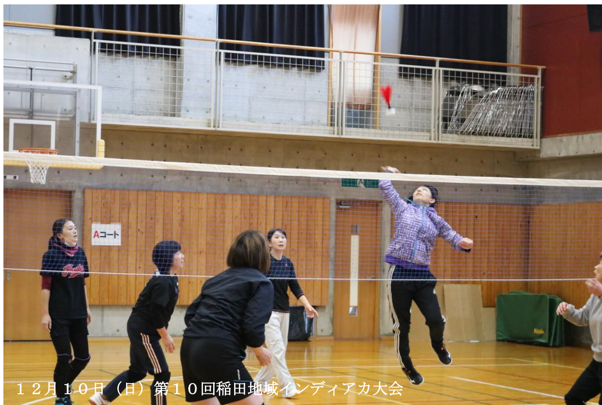
12月10日(日) 第10回稲田地域インディアカ大会