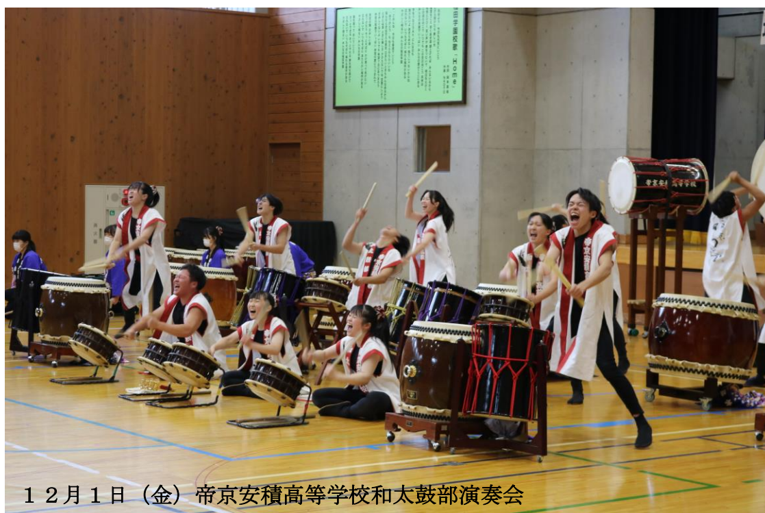
12月1日（金）帝京安積高等学校和太鼓部演奏会

〒962-0043 須賀川市岩渕字岡谷地 32 番地 1 TEL 0248-92-2003 FAX 0248-92-2004 E-mail inada@city.sukagawa.fukushima.jp