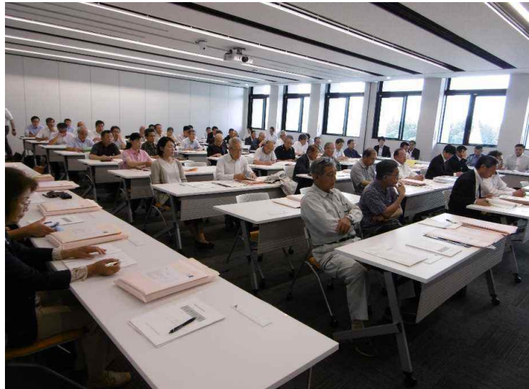
立候補予定者説明会