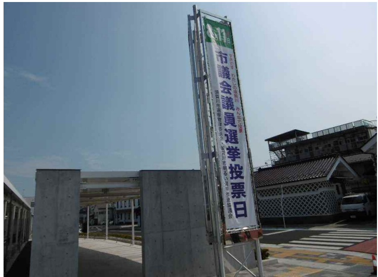
市役所前広告塔啓発懸垂幕