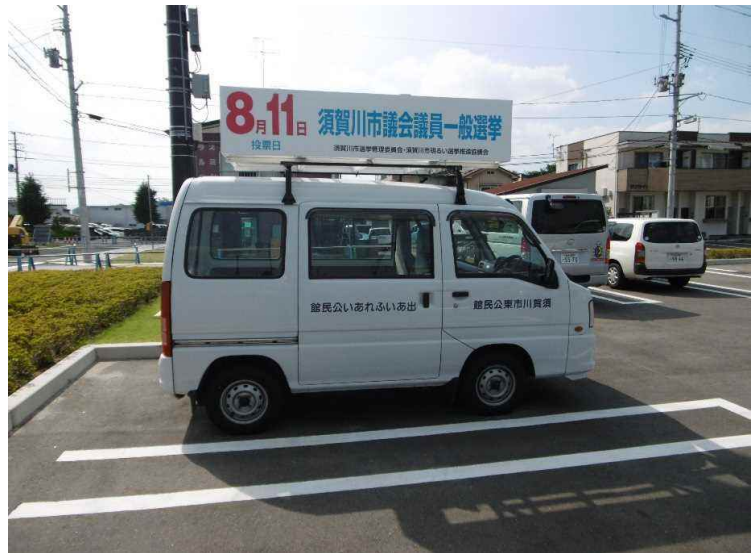
広報活動用啓発車両