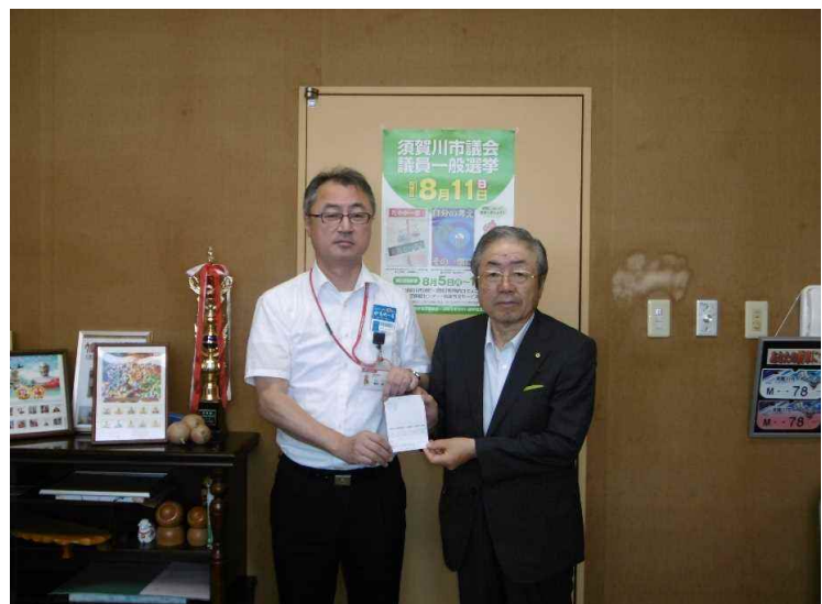
郵便局へ投票所入場券の配付依頼