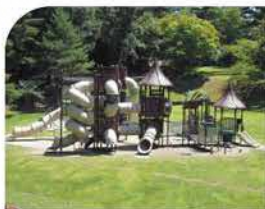
④ 大型複合遊具、芝生広場、博物館、トイレ、飲食施設、温浴施設