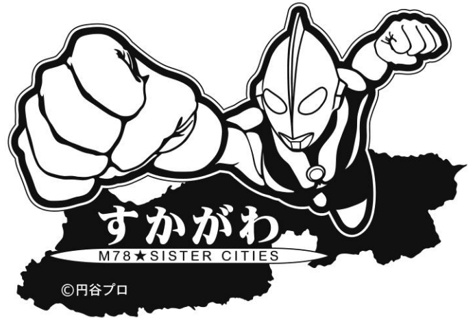
商品化アートワークNo. 2