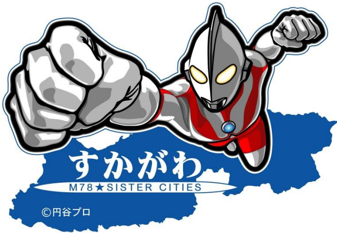
商品化アートワークNo. 1