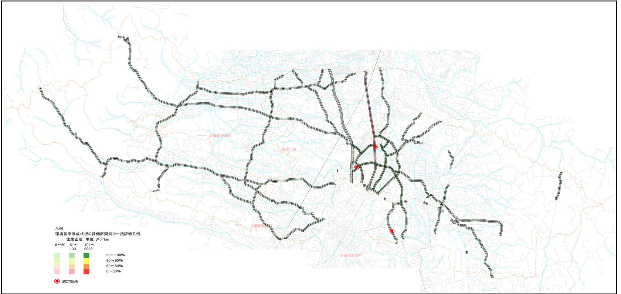
平成30年度 自動車騒音常時監視面的評価 評価区間別環境基準達成状況図