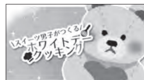
スイーツ男子が作る! ホワイトデークッキング!(3月1日配信)

生活に役立つ情報をはじめ、家族で楽しめる工作や体操などの動画をtette公式Instagramで配信しています。ぜひご覧ください。