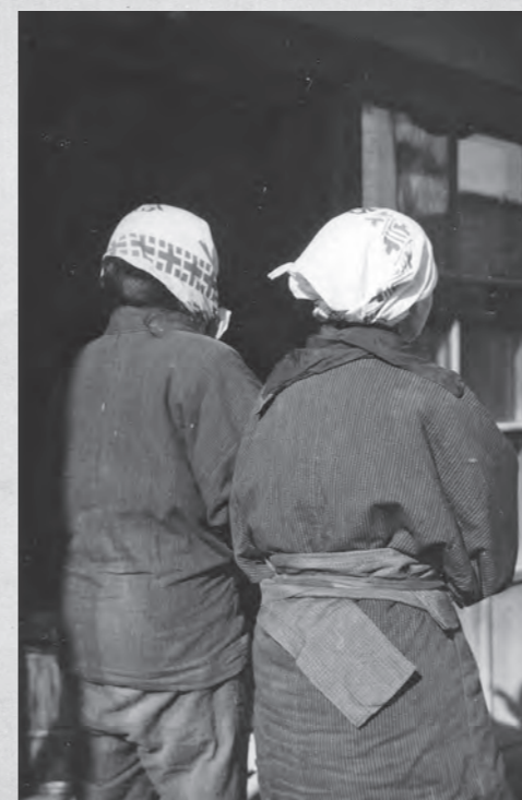
それぞれのスタイルで野良着を着こなす女性たち

3月は次第に暖かくなる季節で、この頃から本格的に農作業を行うところも多いでしよう。写真は、春先に撮影したと思われる「野良着」を着た