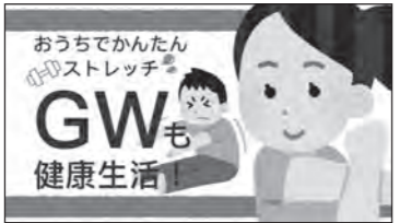
おうちでかんたんストレッチ GWも健康生活! (4月28日配信予定)

生活に役立つ情報はじめ、家族で楽しめる工作や体操などの動画をtette公式Instagramで配信しています。ぜひご覧ください。