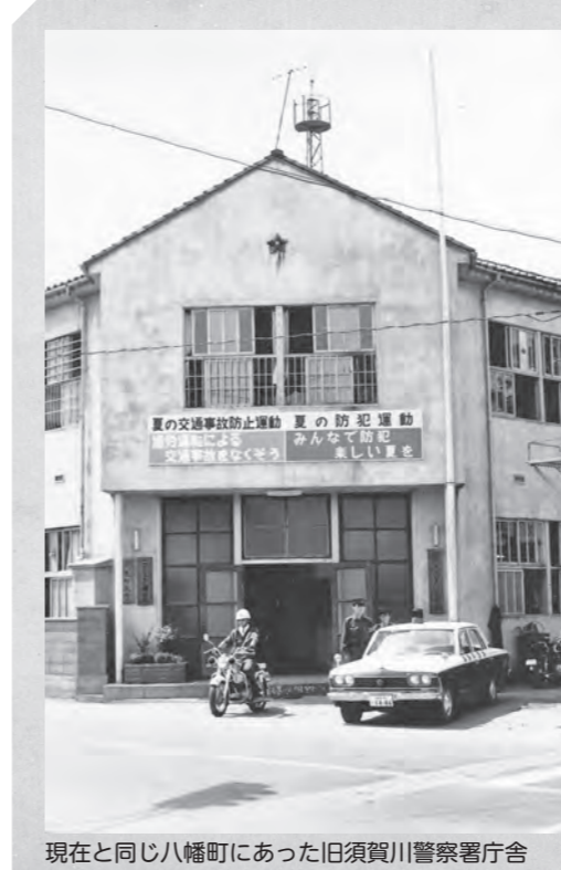
現在と同じ八幡町にあった旧須賀川警察署庁舎