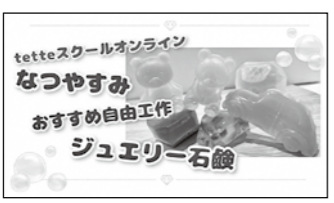
「なつやすみおすすめ自由工作」 6月27日(月)配信

生活に役立つ情報をはじめ、家族で楽しめる工作や体操などの動画をtette公式Instagramで配信しています。ぜひご覧ください。