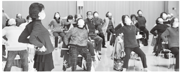
昨年の木曜サロンの様子

tetteスクールシニア「木曜サロン」 7月14日～12月8日(木曜日・全6回) 午前10時～11時30分(第3回と第5回は別に設定) ※事前申込