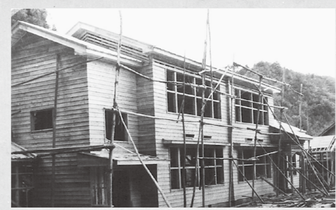
生徒数の増加を受けて増改築する勢至堂小学校

昭和46年には生徒数が9人と減少し、長沼小学校勢至堂分校となりました。平成14年から休校、平成17年に閉校となり、長沼小学校に統合されました。写真は、増改築時の勢至堂小学校です。現在、建物は取り壊され残っていませんが、門標がその面影を伝えていきます。