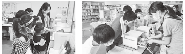
tetteでおしごとたいけん 寺子屋でのワークショップ