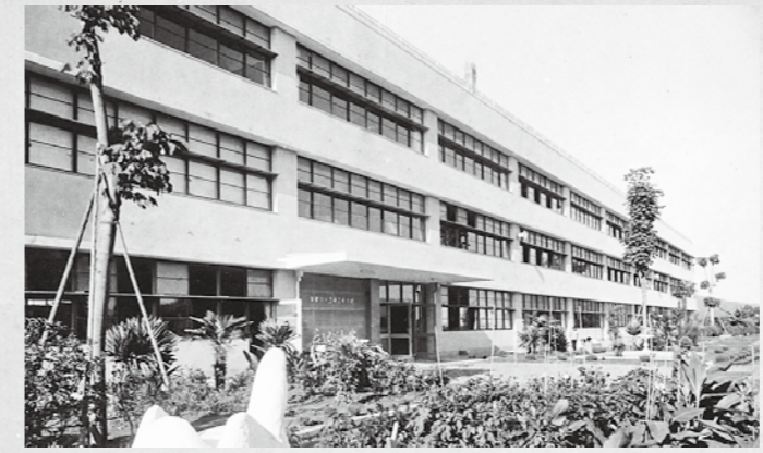
当時最先端の鉄筋コンクリート造で建てられた第三小学校

第三小学校は、前田川小学校と浜田小学校、第一小学校の一部を学区として、昭和34年に開校しました。第一小学校の生徒数の増加や、昭和29年の須賀川町と浜田村との合併などで新しい小学校が必要となり、牡丹園近くに校舎が建てられました。 第三小学校の現住所は「朝日田」ですが、昔は「人参畑」という地名でした。第三小学校の Mascot キャラクター「キヤロン」は「人参(キヤロット)」が由来です。 写真は、昭和38年に撮影された校舎です。小学校としては市内初となる、当時最先端の鉄筋コンクリート造で建てられました。これ以降、木造校舎を鉄筋コンクリート造に改築する学校が増えました。この校舎建築の変化も、学校の歴史を語る上で欠かせません。 博物館 ☎(75)3239