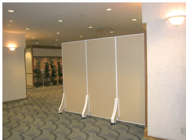
ハニリアルボードとアクセサリを組み合わせたパーテーション