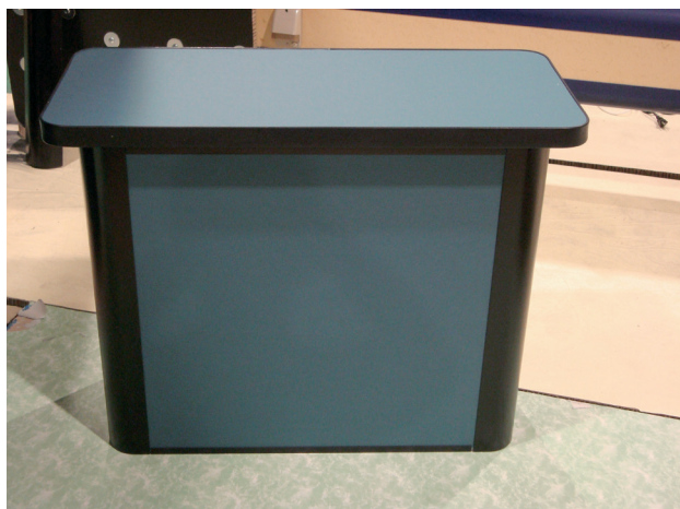
ハニリアルボードとアクセサリを組み合わせたテーブル