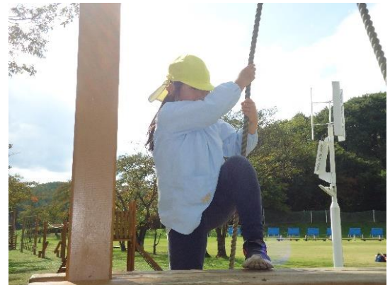
丸太で作った遊具で遊んだよ！ 右手に見えるのは風力発電だよ。 (福島県郡山自然の家)