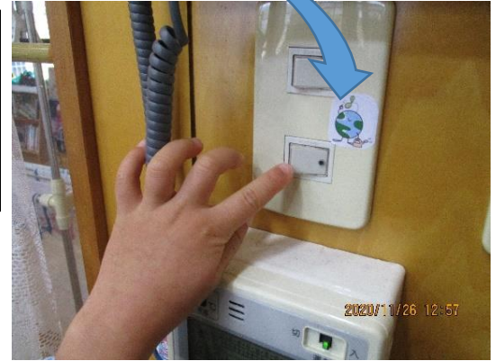
ぼく、日直。電気を消そう！ スイッチは、エコタンシールがはって あるところだよ