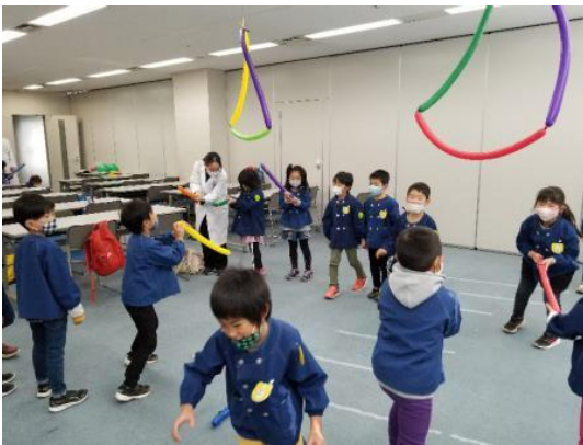
風船やバルーンで遊んだよ！ (郡山市ふれあい科学館)