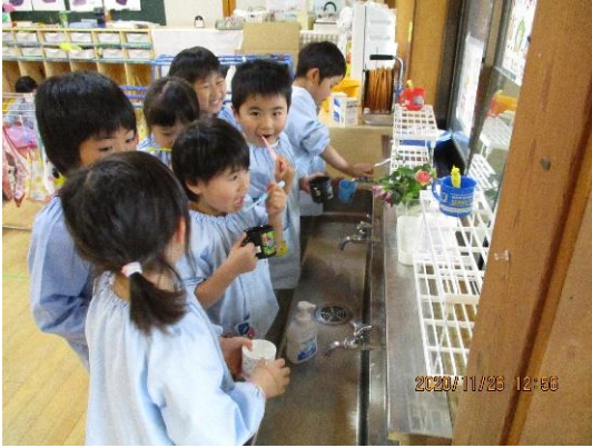
水を出しっぱなしにしないで コップに水を入れて歯磨きだ！