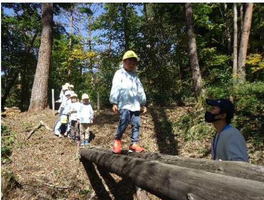
自然探索、丸太渡りもしたよ！ (福島県郡山自然の家)