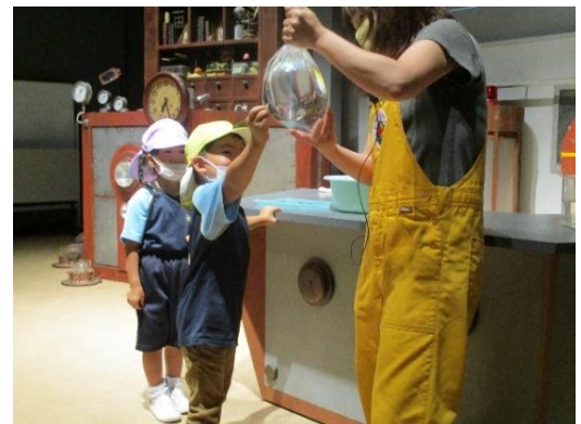
水エネルギーってすごいね！ (ムシテックワールド)